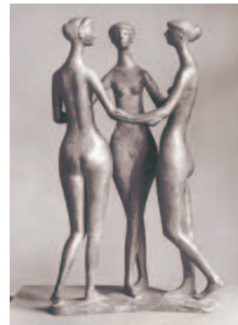
G. Marcks "Drei Grazien" 1957

UN PERCORSO ESPERIENZIALE CORPOREO DI 8 INCONTRI PER DONNE DI TUTTE LE ETA'