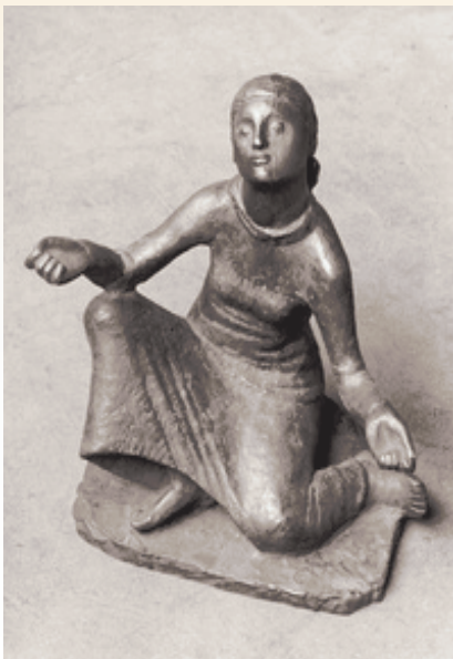
G. Marcks "Danae" 1937

L' AGCT - Associazione Gestalt Counselling Torino - nasce da un gruppo di counsellor e di professionisti impegnati nelle relazioni d'aiuto (psicologi, insegnanti, formatori) che intendono divulgare i principi e i metodi del C o u n s e l l i n g quale sostegno alla persona secondo l'orientamento gestaltico.